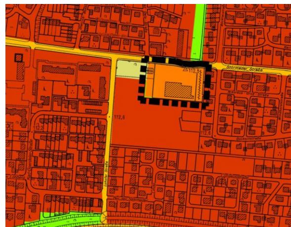
115. Änderung des FNP

Die bislang dargestellte Sonderbaufläche sowie die Grünflächen werden mit der 115. Änderung des Flächennutzungsplans in ein Sondergebiet gem. § 11 (3) Nr. 2 mit der Zweckbestimmung großflächiger Einzelhandel und der Art der baulichen Nutzung: Lebensmitteldiscounter mit einer maximalen Verkaufsfläche von 1.200 qm geändert.