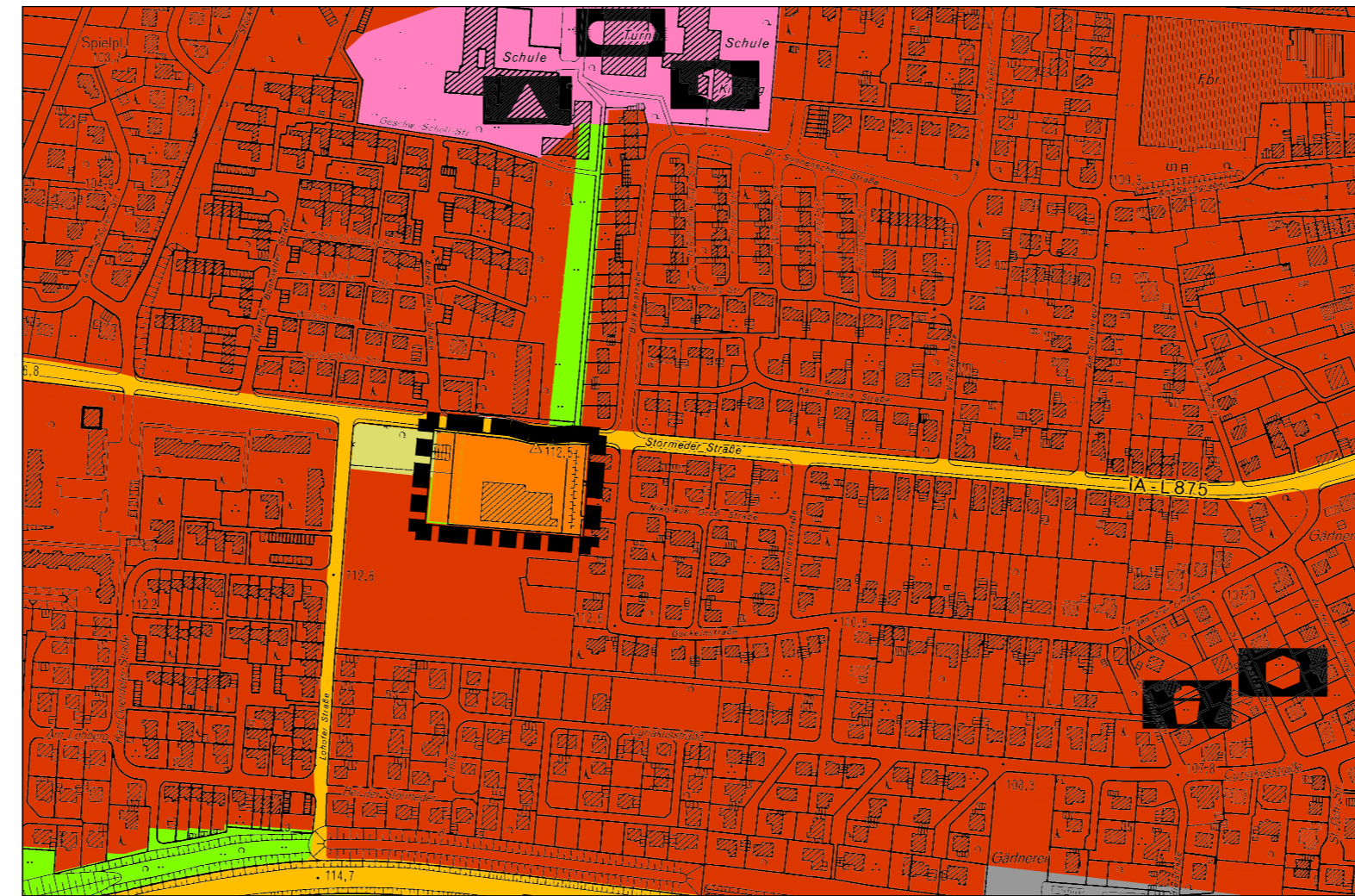
115. Änderung des Flächennutzungsplans