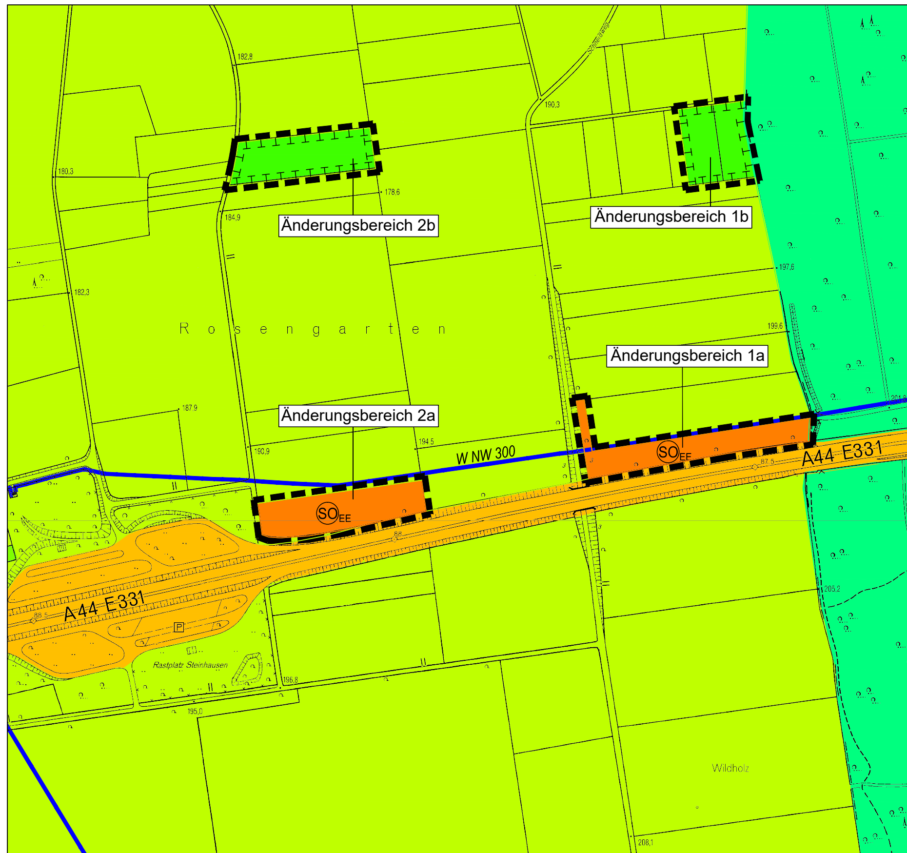
geplante 103. Änderung des Flächennutzungsplans