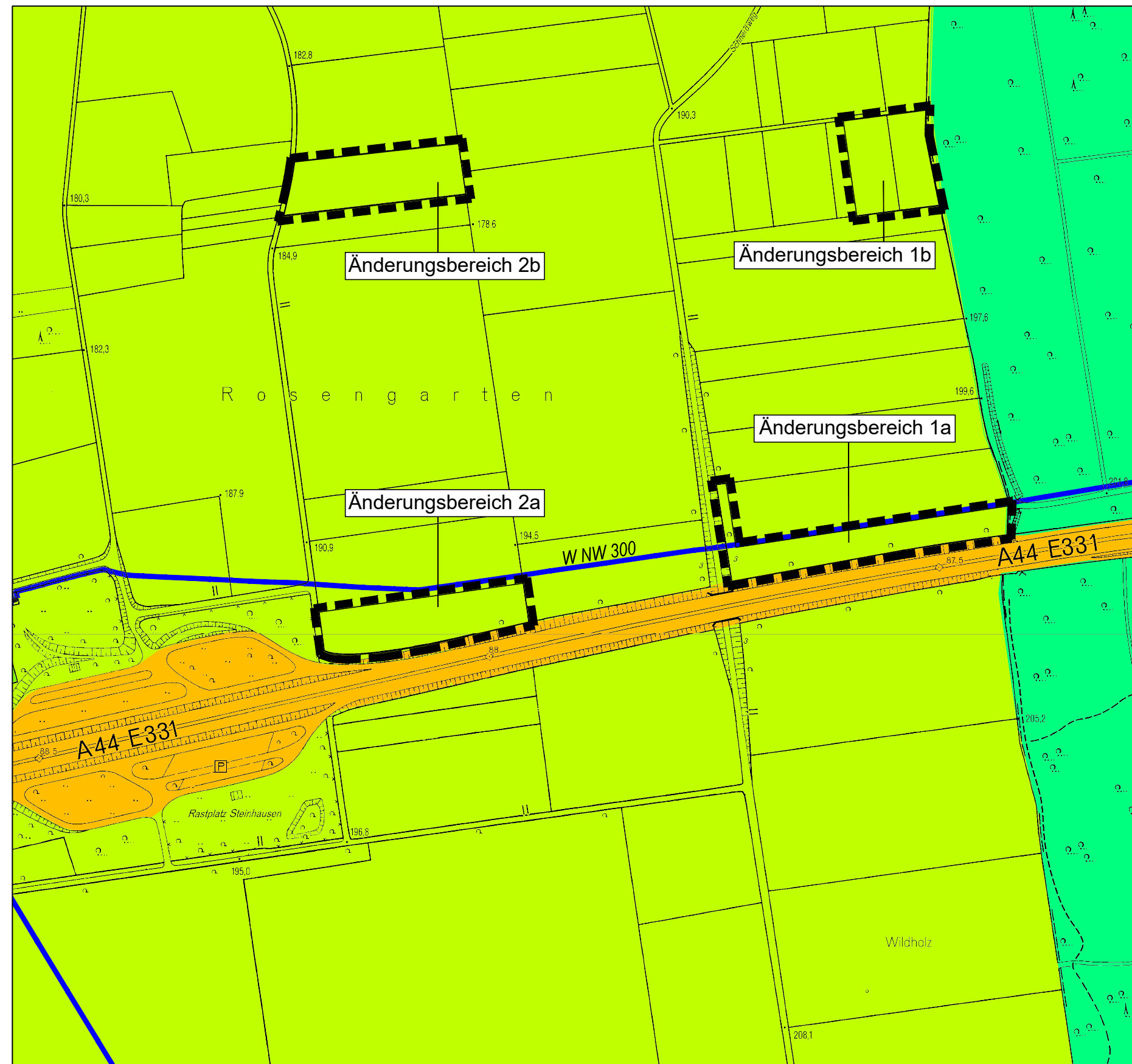
Auszug aus dem rechtswirksamen Flächennutzungsplan