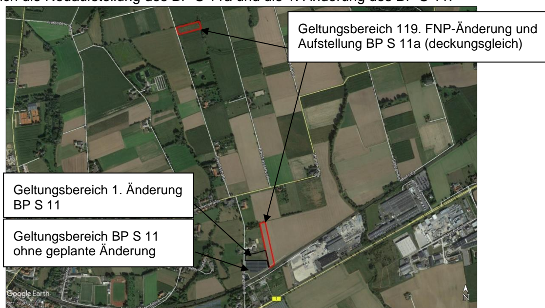
Abbildung 1: Übersicht Lage Geltungsbereiche 119. FNP-Änderung und BP S 11a (rot), 1. Änderung BP S 11 (schwarz) und BP S 11 ohne Änderung (grau) (Hintergrund: GoogleEarth, Bilddatum 9/18/20)

Die Aussagen des vorliegenden Artenschutzbeitrags zum geplanten Bauvorhaben (Solarparkerweiterung), das mit der 119. FNP-Änderung i.V.m. der Aufstellung des BP S 11a und der 1. Änderung des BP S 11 planerisch vorbereitet werden soll, gelten für die Planungsverfahren gleichermaßen. Die Ermittlung der planungsrelevanten Arten sowie die vorhabenbezogene Wirkungsprognose und artenschutzrechtliche Konfliktanalyse erfolgt dabei anhand der umfassenderen sowie planungsrechtlich nachgelagerten und verbindlichen Bebauungsplanverfahren - sprich die Neuaufstellung des BP S 11a und die 1. Änderung des BP S 11.