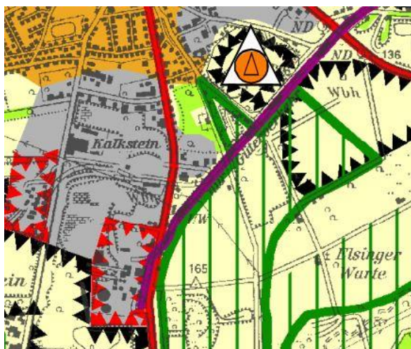
Ausschnitt aus dem rechtswirksamen Regionalplan Arnsberg, Teilabschnitt Kreis Soest und Hochsauerlandkreis; Blatt 3; ohne Maßstab