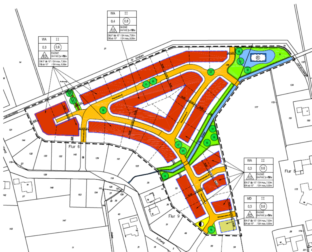
Abb. 2 Auszug aus der zeichnerischen Darstellung des Bebauungsplanes Ehringhausen Nr. 10/4 „Nördlich Triftweg“ (SMOLIN 2020B).

Die innere Erschließung erfolgt über die im Baugebiet dargestellte gegenläufig befahrbare Planstraßen A, B und C und den Stichstraßen A + B. Der genaue Ausbau der Straßen und Wege ist nicht Bestandteil dieses Bebauungsplanes und wird im späteren Ausbauentwurf der Erschließungsplanung erarbeitet (SMOLIN 2020A).